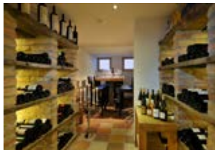
Weinkeller „Beerankallar“ Zeit für neue Eindrücke, für neue Gerüche