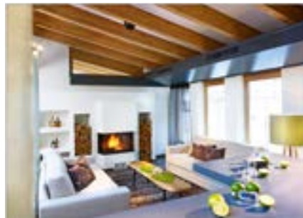
Bar Hoangarten - Kaminecke Zeit für Gespräche zwischen den Zeilen