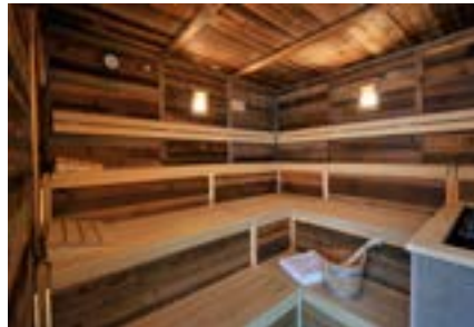
Bio-Altholz-Sauna Zeit für's Rausschwitzen, für Entschlackung