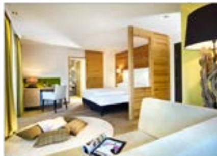
Beispiel Kategorie Junior Suite ca. 37m 2 mit grosser Terrasse und schönem Talblick