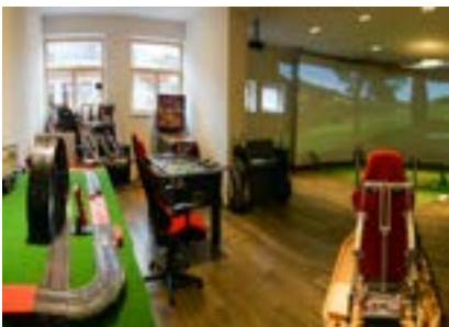
Männerspielzimmer Zeit für's Spielen - Formel 1 und Golf Simulator