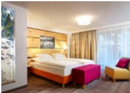
Beispiel Kategorie Jöchle Doppelzimmer auch zur Alleinnutzung, ca. 20qm