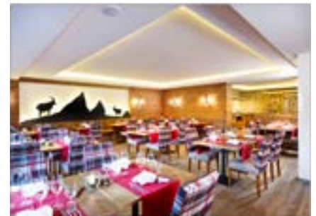
Restaurant Gamezza Zeit für kulinarische Hochgenüsse