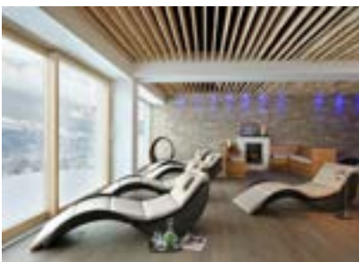
Ruheraum Zeit für Weitblick, für das in sich gehen