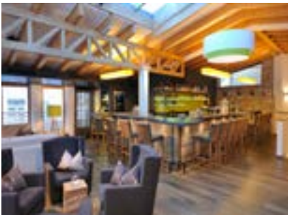
Bar Hoangarten Zeit für Genuss, Erholung und Zusammensein