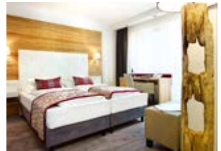
Beispiel Kategorie Bärenkopf Doppelzimmer auch zur Alleinnutzung, ca. 22qm