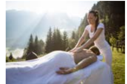
Massagen & Kosmetik Zeit für Ihre Muskeln und Ihre Seele